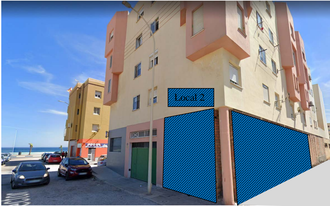
Fachada lateral C/Colector.