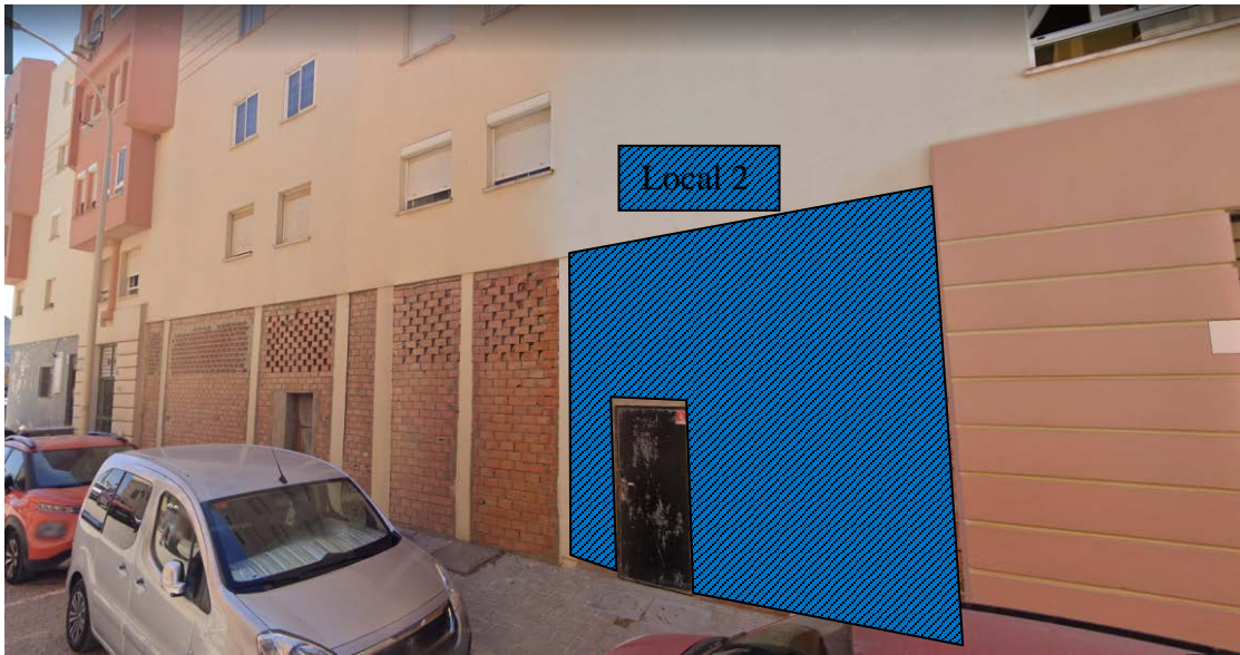
Calle San Fernando.